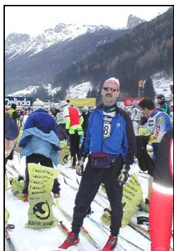
Bildet er fra før start.

I januar fikk han oppfylt drømmen om å gå Marcialonga. Det er et populært turlangrenn i de italienske alper.