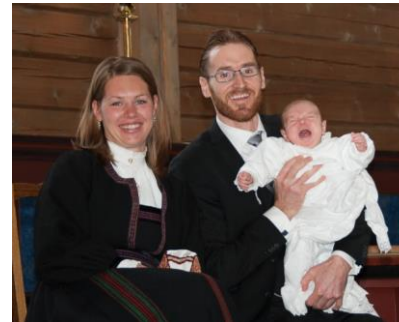
Bryllup og dåp i Soknedal kirke

hadde sin jubelhelg med både bryllup og barnedåp i Soknedal kirke i mai. Begivenheten ble behørig feiret på Horg bygdetun og i Olderveien etter leggetid.