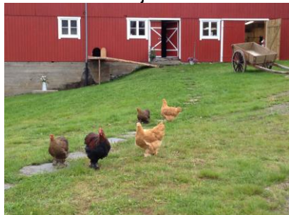
Høns på tunet og kortreiste egg.

skaffet seg høns i sommer og koser seg når de tripper rundt på tunet i Staverløkja.