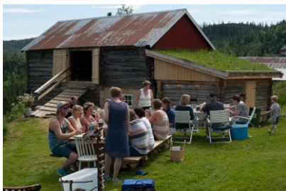
Bursdagsfeiring i Staverløkja