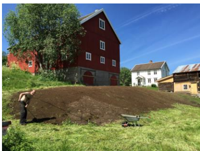
Idar hjelper med å rake før såing.

Mye av ferien gikk til utomhusarbeid i Staverløkja. Bl.a. flytting av veien forbi eldhuset. Takk til dere som gjorde det mulig. Nå blir det fin plass til stabburet ☺.