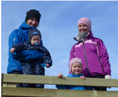
Hele familien på verandaen på den nye dokkestua.

bor på Oppdal. De er en skikkelig friskusgjeng som driver med både klatring, sykkel, ski og drar på tur så ofte de kan.