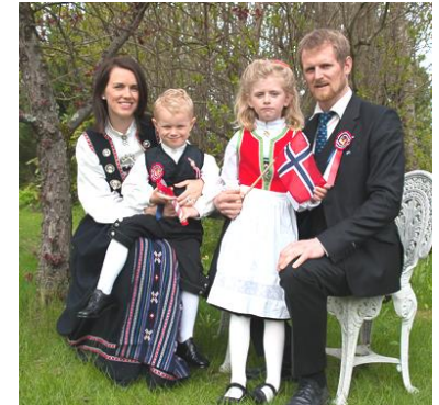
Familiebilde tatt 17.mai

venter også familieførøkelse så det er visst «noe som går».