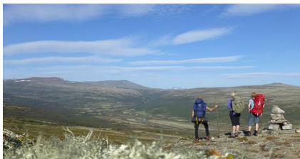
Utsikt utover Grimsdalen