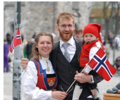
17.mai i Trondheim