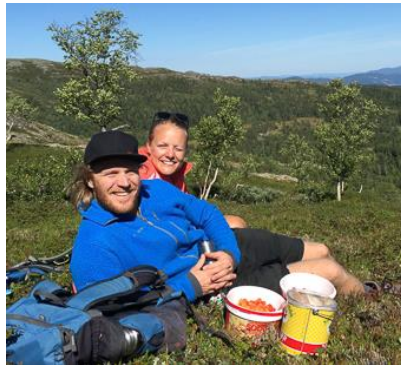
På moltetur i Soknedal