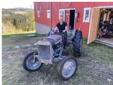
Idar prøvekjører gråtassen

Det blir ikke så mange stundene i motorbua, men i sommer fikk vi start på gråtassen..