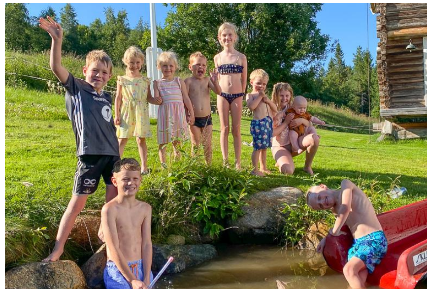
Barnebarna i Staverløkja godvæerspina 2020

Jula er rett rundt hjørnet og det har gått et år igjen siden forrige julebrev. Et rart år. Jahn Teigen døde og korona invaderte oss. Ord som karantene, smittevernregler, munnbind m.fl. ble vanlige begreper. Og vi fikk ikke dra til Staverløkja. Korona har sine små og store konsekvenser for oss alle. Mange får føle på ensomhet og isolasjon.