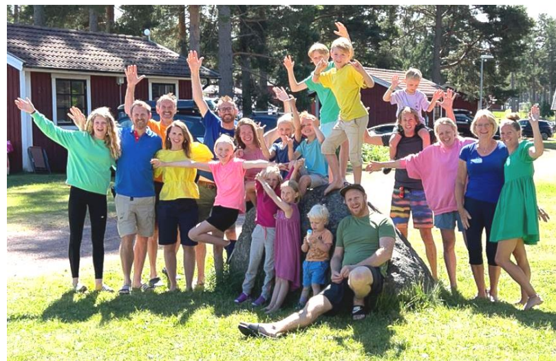
Hele gjengen samlet på ferietur i Leksand ( to er ennå i mors mage)