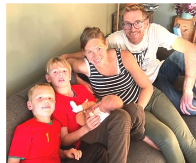
Stolte storebrødre og foreldre!